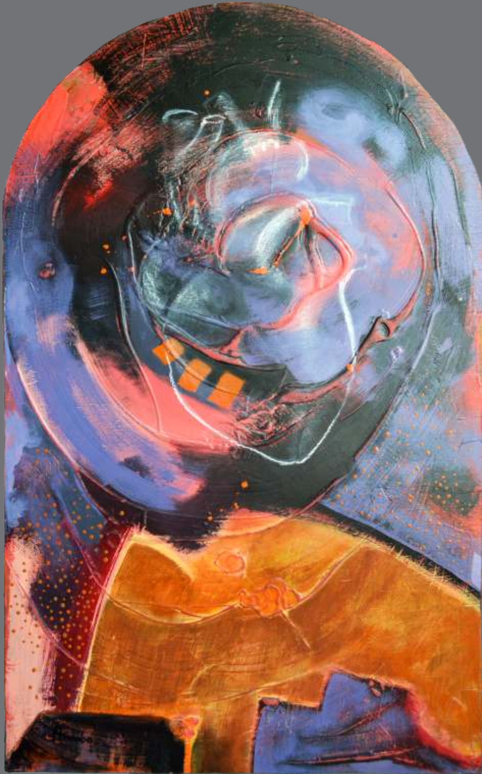
Artero (2019) Acrílico sobre madera intervenida 79 x 49.5 cm $ 9,800 MXP