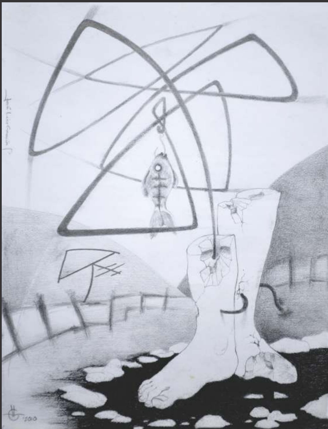
Recuerdo de la laguna (2010) Lápiz sobre papel 31 x 24.5 cm $ 1,500 MXP