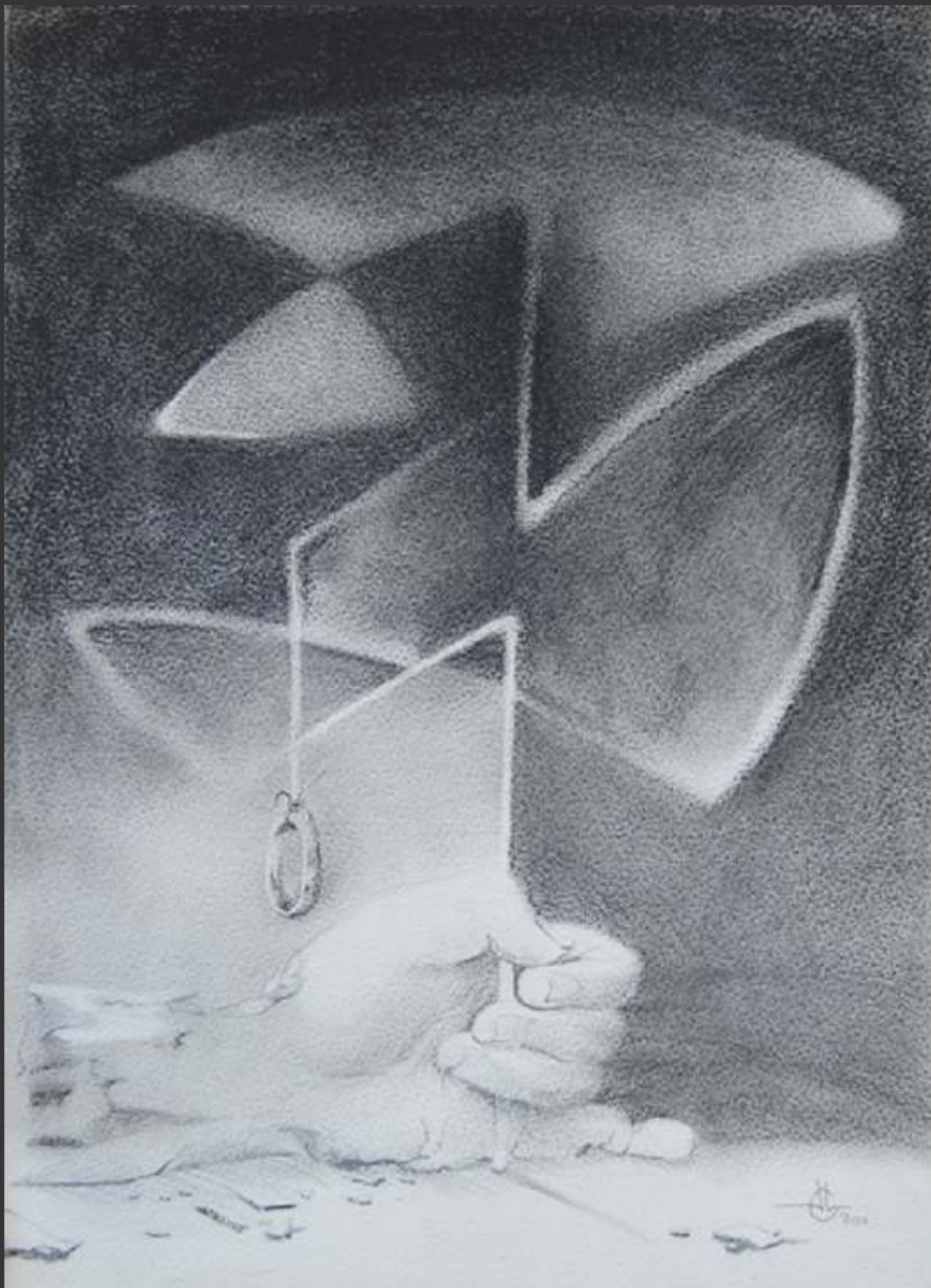
El Compromiso (2011) Carboncillo, lápiz y pastel sobre papel 36.5 x 27 cm $ 2,000 MXP