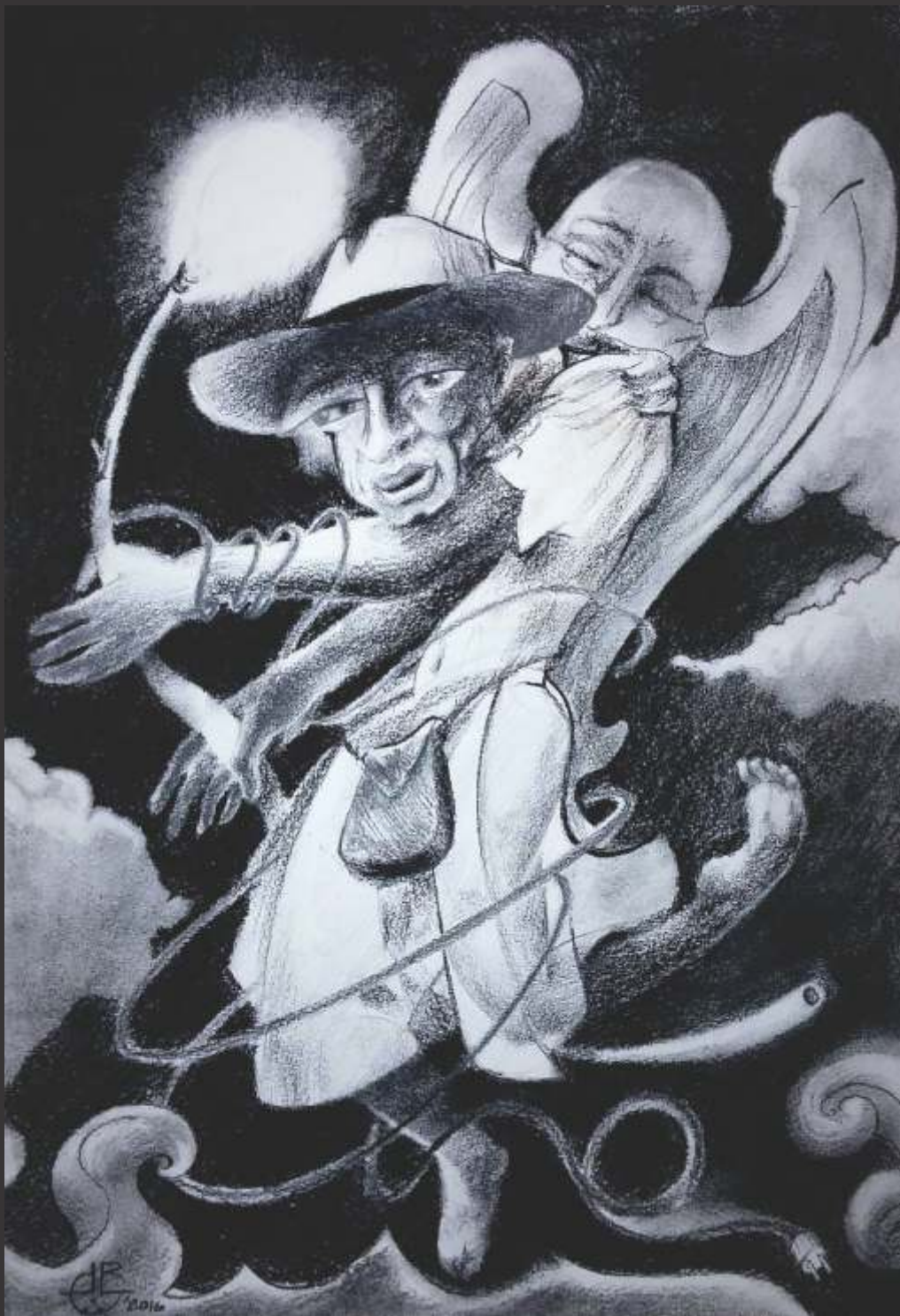
El ladrón de la luz (2016) Carboncillo y lápiz sobre papel 50 x 35 cm $ 3,500 MXP