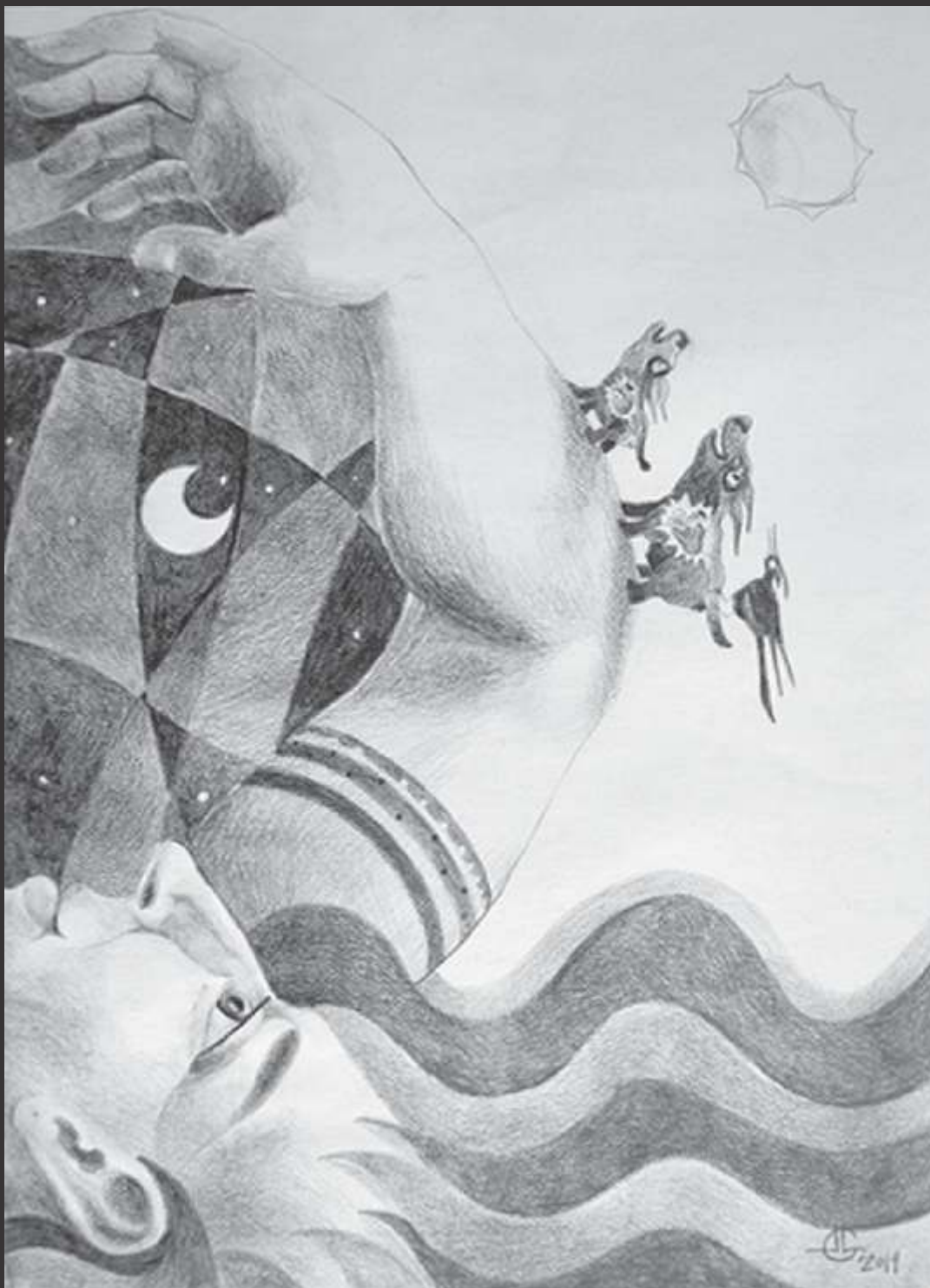
Nado de dorso (2014) Lápiz sobre papel 46 x 33.5 cm $ 3,100 MXP