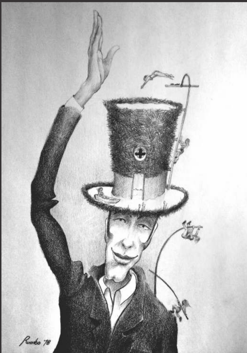
La atracción del siglo (2018) Lápiz sobre papel 35.5 x 22 cm $ 1,500 MXP