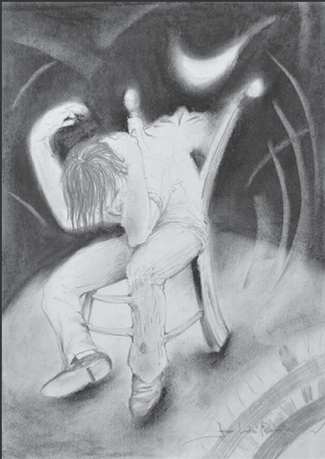
Angustia existencial (2011) Carboncillo y lápiz sobre papel 33.5 x 24 cm $ 1,600 MXP