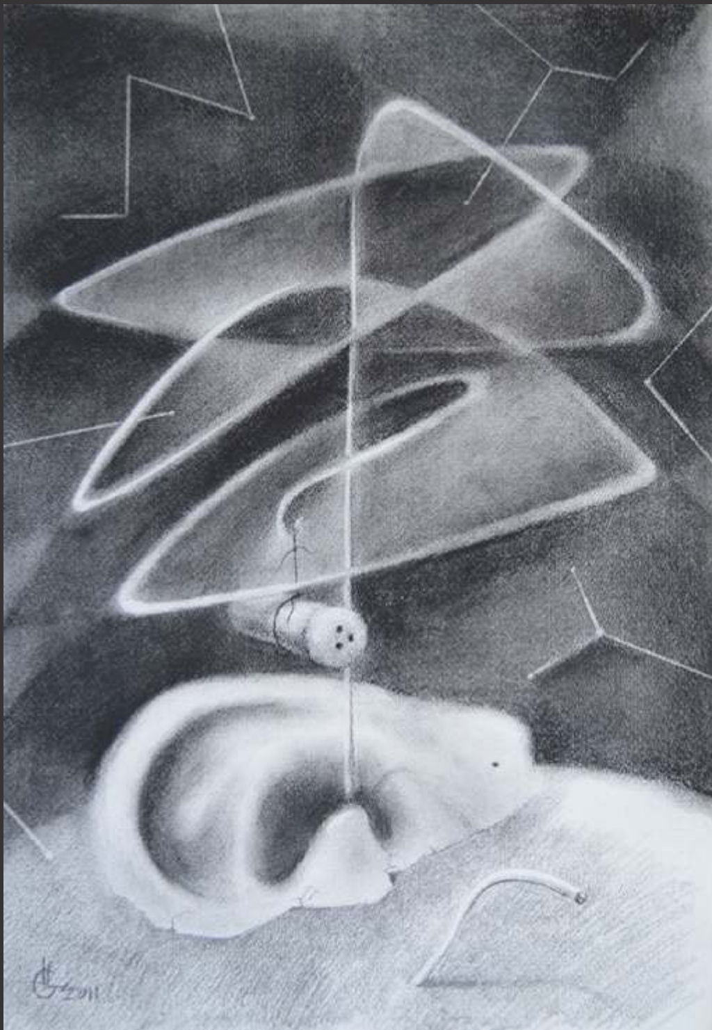
El chisme (2009) Carboncillo y lápiz sobre papel 50 x 35 cm $ 3,500 MXP