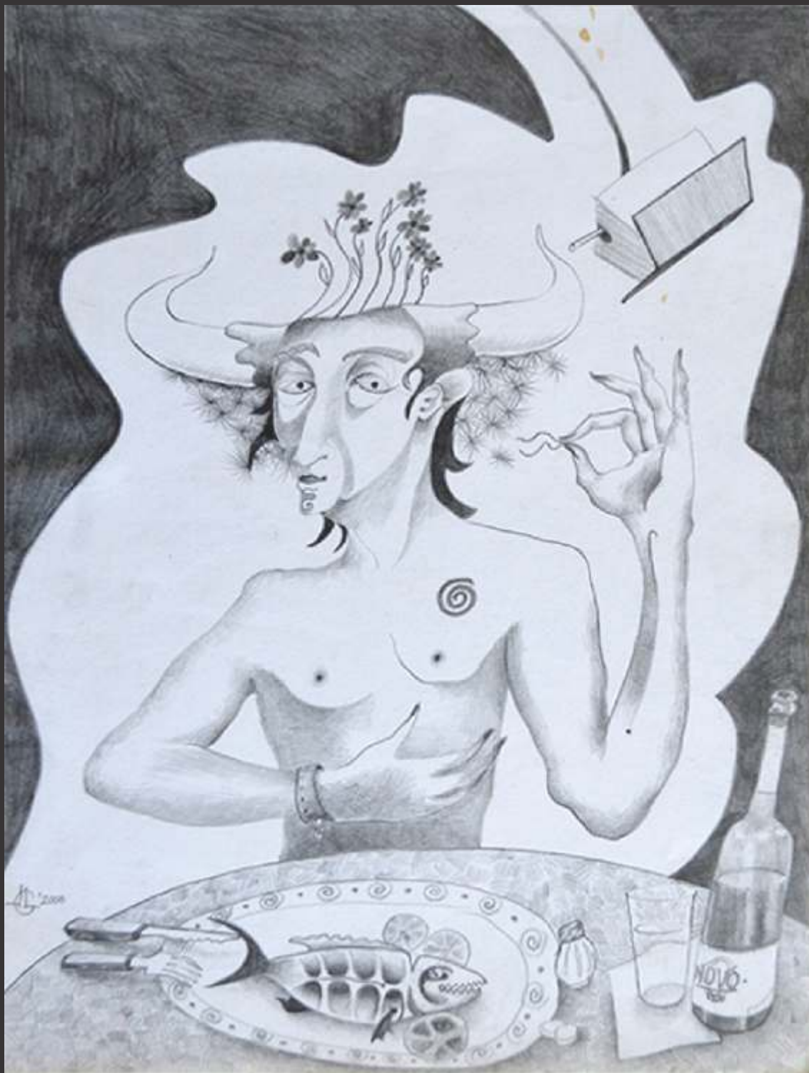
Cena fría (2009) Lápiz sobre papel 30 x 22.5 cm $ 1,350 MXP